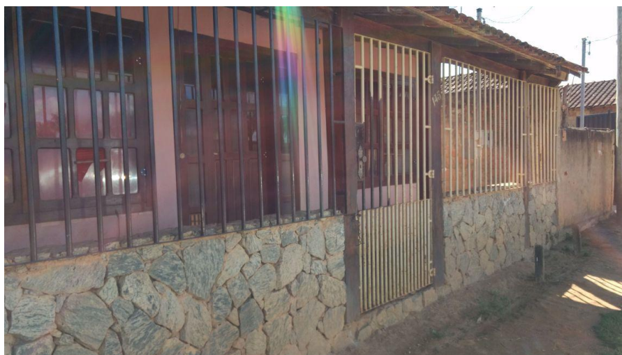
Figura 1. Registro fotográfico da visita.

No dia 10/06/2017, equipe técnica da empresa Synergia, enviou SMS para os números declarados pelo manifestante, com o objetivo que a família entre em contato com a empresa para realização do Cadastro Integrado.